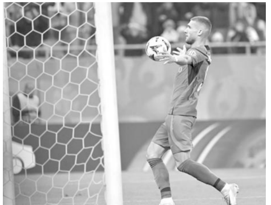
Ritkán látni olyan gólt, amilyent Birligea ezzel a képen látható mozdulattal szerzett a második féldő 9. másodpercében

Ugyancsak csütörtökön a Galatasaray 3-2-re verte a Tottenhamet, amelyben végig pályán volt Radu Drăgușin. A román válogatott védő azonban több hibát is elkövetett a mérkőzésen, és egyáltalán nem tudta tartani a két gólt szerző Victor Osiment. Ráadásul a török csapat egyik gólját megelőzően eladta a labdát, mert túl hosszsan vette át, és a rátámadó Icardi elcsente tőle, majd nigériai csapattársához továbbított, aki gólt szerzett.